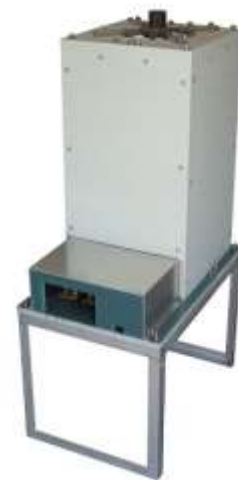
過熱ユニット (KU-25WSH) 外観