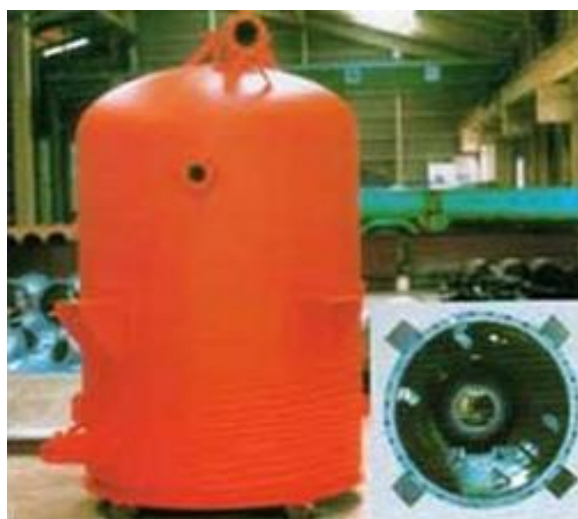
タンク内面ポリエチレンライニング