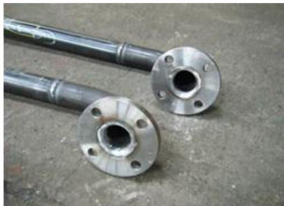
ライニング管用仕上げ済みの配管