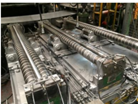
ベンディングロール取り換え 中間ロールは溝付きタイプ(アルミ粉対策)