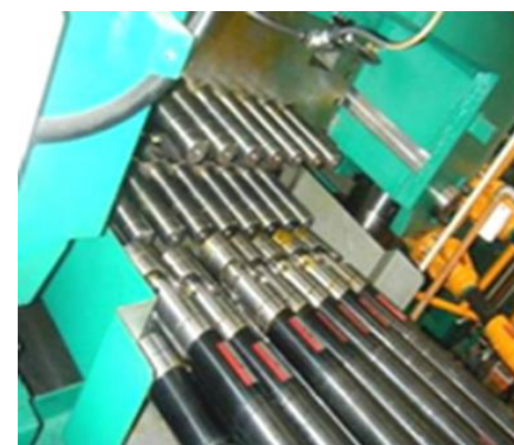
ユニバーサルジョイント給油及び位置決め