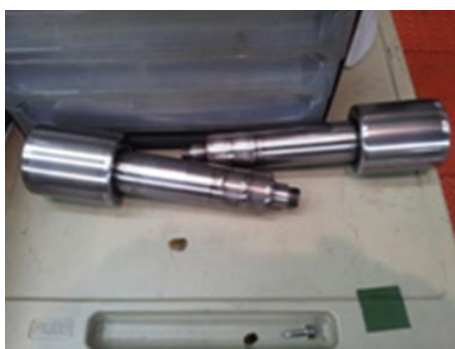
バックアップロール取り換え